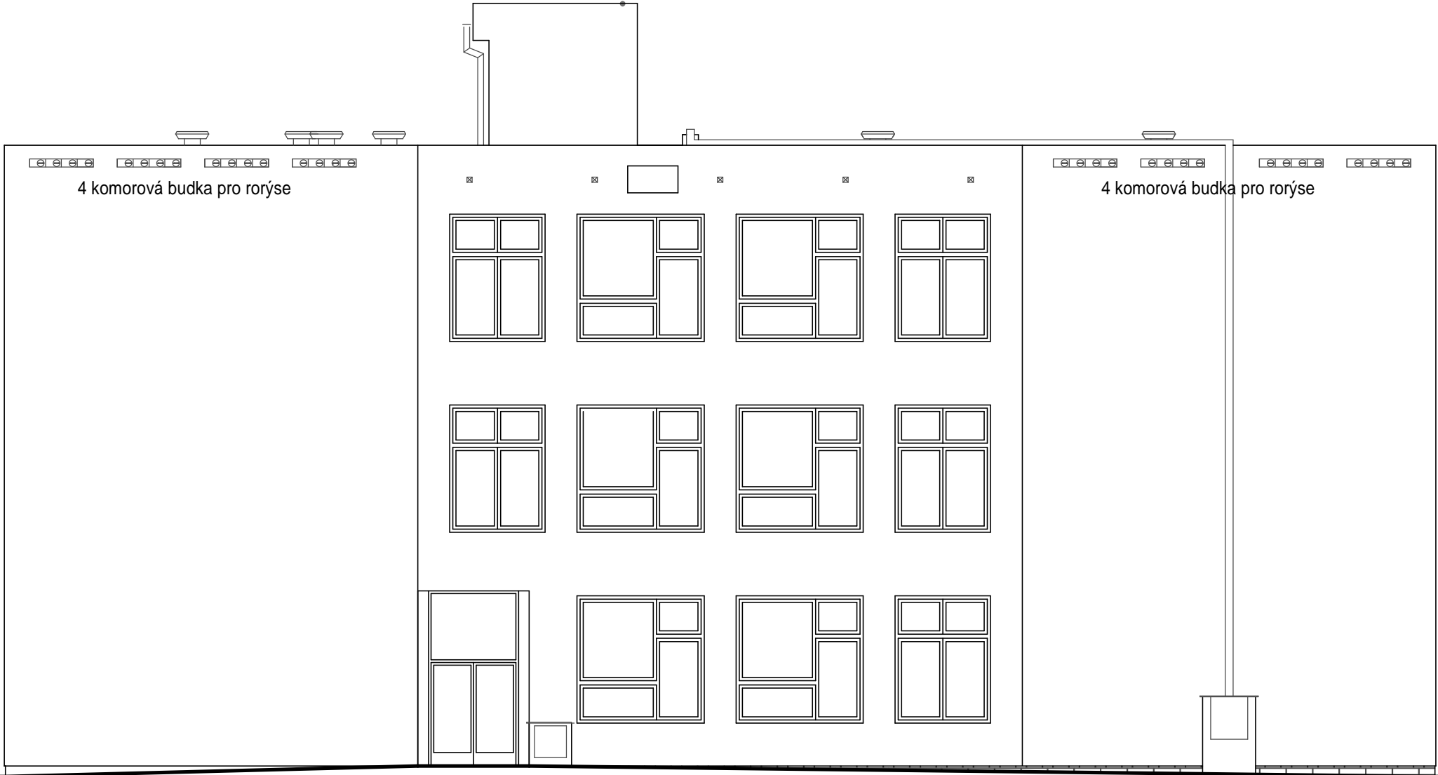
Objekt 2 - vstup a vedení školy